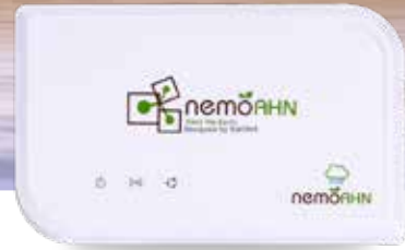
락온익스 스마트 허브

당신이 해외에서 바다낚시를 즐길 때도 '락온익스 스마트 온·습도계'는 실시간 온도와 습도를 스마트폰 앱으로 보여주고